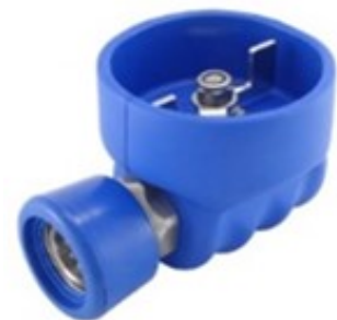
BALRCP1-B RVS 304; 1/2" bi.dr. x snelkoppeling met EPDM protectie