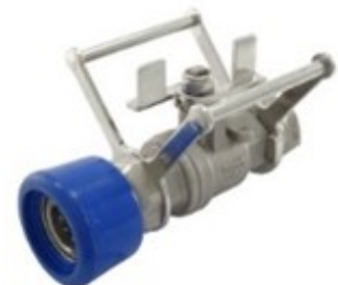
BARRCP2-B RVS 316; 1/2" bi.dr. x snelkoppeling met EPDM protectie

Alle vetgedrukte artikelnummers zijn uit voorraad leverbaar.