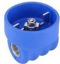
BALR001-B In RVS 304; 2x 1/2" bi.dr.