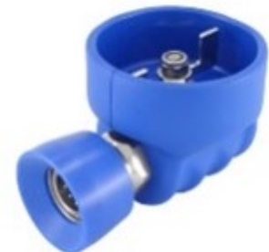
BALRCP1-NB RVS 304; 1/2" bi.dr. x snelkoppeling met nylon protectie