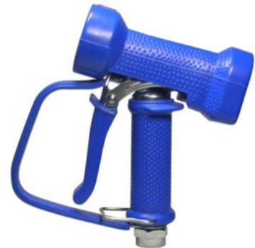
AKCNP01-B met veiligheidsbeugel in blauw