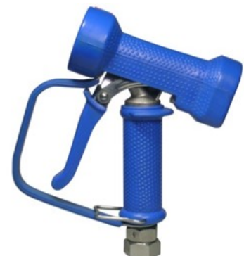
AKCNP01-B-SW12 (blauw) met draaikoppeling 1/2" BSP bi.dr.