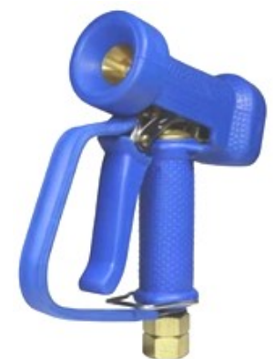
AKMNP01-B-SW12 met draaikoppeling 1/2" BSP bi.dr.