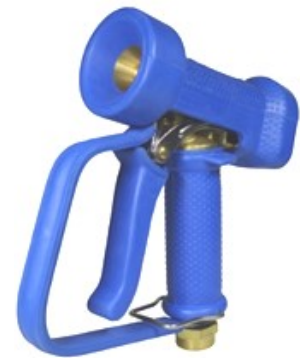
AKMNP01-B met veiligheidsbeugel