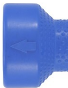
Pijl voor de straalrichting