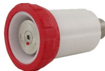
TWRWR02L 3/4" BSPP mâle, 60° joint conique