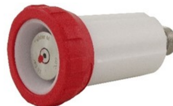
TWRWR02M 1/2" BSPP mâle, 60° joint conique