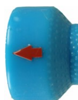
Flèche rouge pour la direction du jet