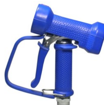
AKCNP01-B bleu avec pontet