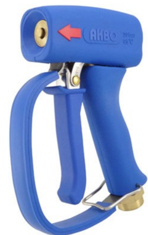
AKMNP11-B avec pontet