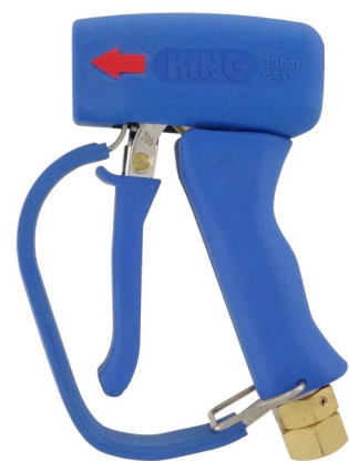
AKMNP11-B-SW12 avec pontet et entrée pivotante

Tous les numéros d'articles en gras sont disponibles en stock.